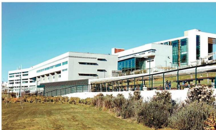
La PUCV estrenará el Doctorado en Didáctica de las Ciencias, único de su tipo en Chile.

Durante ocho semestres los futuros doctores desarrollarán una única línea de investigación que, entre otras materias, permitirá que dominen y apliquen conocimientos en Internet de las cosas (IoT), analítica del aprendizaje, pensamiento computacional, análisis de redes sociales, informática en salud y