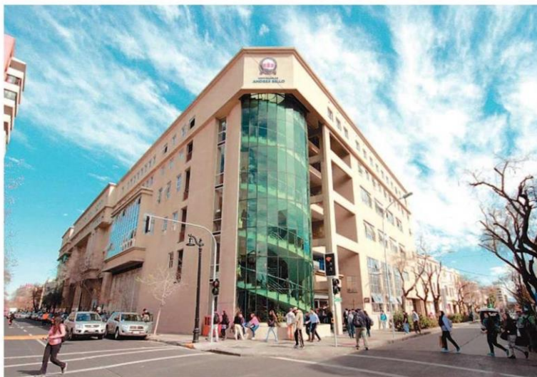
Para 2021 la Universidad Andrés Bello tiene programada la partida de 34 diplomados.